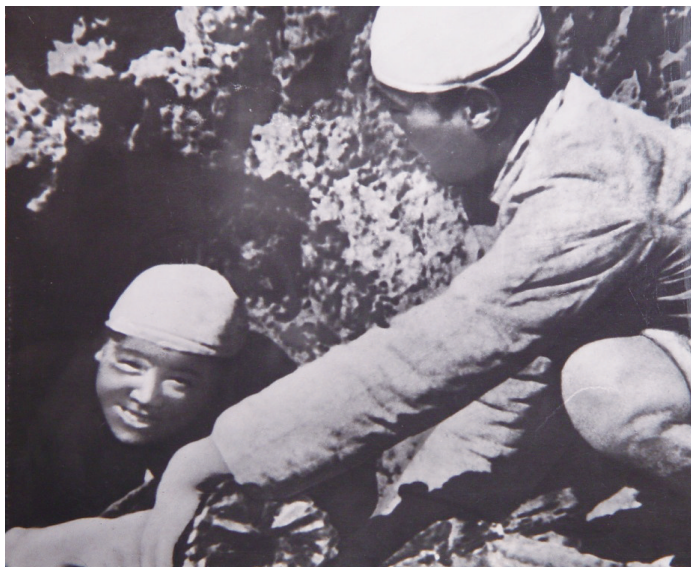
张思德(左)和战友一起烧炭

追悼会结束后,时任中央政治局秘书的胡乔木根据讲话记录,对毛泽东的这篇即兴演讲进行了认真整理。毛泽东看后稍事斟酌,随即在文章上方挥毫,从此“为人民服务”这5个遒劲有力的大字便成了这篇著名演讲的标题,成为中国共产党人的一面旗帜。