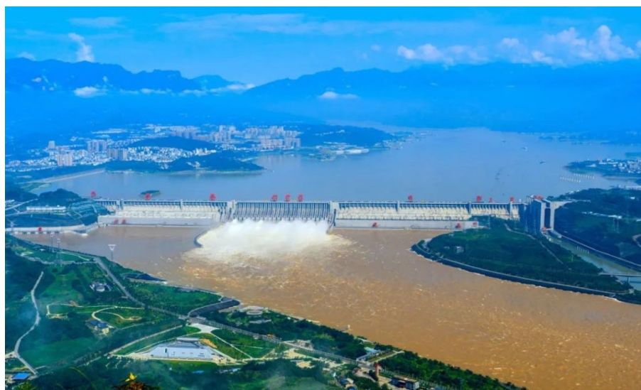
三峡大坝绿色发电