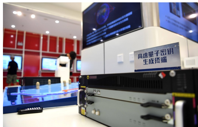
“高速量子密钥生成终端”模型。

量子通信提供了一种原理上无条件安全的通信方式，从目前情况来看，是最先可能走向实用化的量子信息技术。潘建伟院士领衔的“广域量子通信研究集体”瞄准这一目标全面开展研究，取得了一批重要的创新成果：完全自主地研制了世界上首颗空间量子科学实验卫星，建成了世界上首条国家量子保密通信“京沪干线”，创新性地突破了天地双向高精度光跟瞄、空间高亮度量子纠缠源、抗强度涨落诱骗态量子光源、高速高效率单光子探测以及空间长寿命低噪声单光子探测等关键技术；在国际上率先实现了千公里级星地双向量子纠缠分发，从卫星到地面的量子密钥分发和从地面到卫星的量子隐形传态，洲际量子密钥分发等系列成果；建设完成的天地一体化的量子通信网络雏形使得我国在量子通信领域的研究水平全面处于国际领先地位。