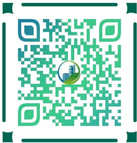
扫一扫上方二维码可下载附件