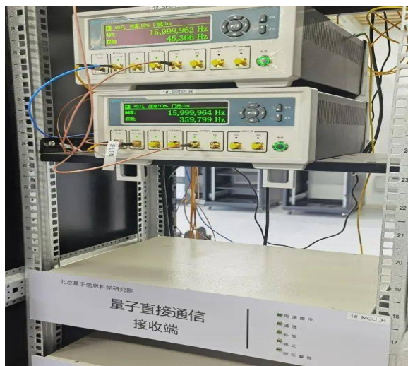
量子直接通信样机

2016年以来，清华大学和北京量子信息科学研究院的联合团队合作，提出了多种关键技术，解决了量子直接通信实用化中的一些关键难题。