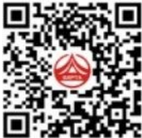
广西人事考试考生 疫情防控报备系统二维码

广西2022年度考试录用公务员(选调生)、公开遴选公务员笔试将于7月9日正式开考。日前,广西人事考试院发布通告称,不按要求报备的,进入考点时将被疫情防控自动核验设备拦截,需到“人工核验通道”现场进行疫情防控信息流调和评估,因此影响考生正常考试后果由考生自行承担。2022年7月4日8:30至7月9日9:30,考生可登录广西人事考试网打印准考证栏目下载打印《准考证》。每场考试前,考生应提前80分钟到达考点。