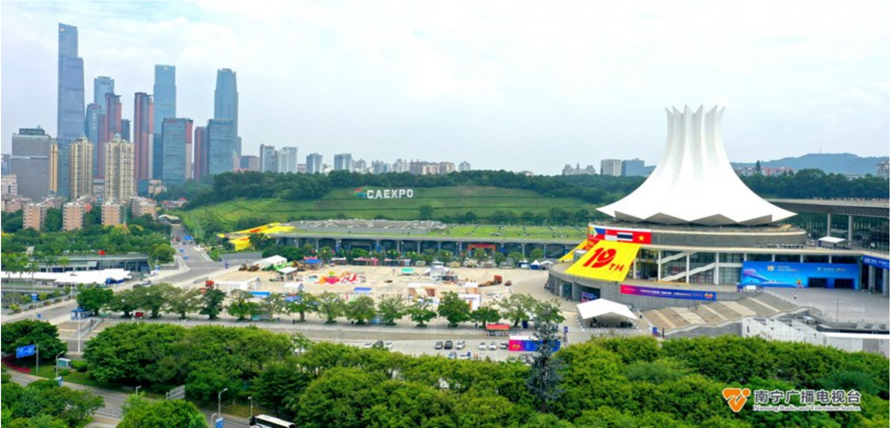
南宁国际会展中心装饰一新,喜迎第19届东博会、峰会的到来