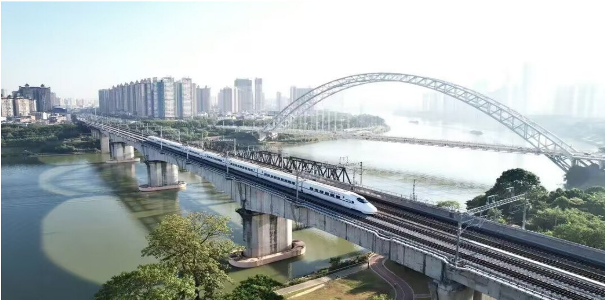
在南宁至崇左段试运行的高铁列车驶过南宁邕江铁路大桥

南凭高铁南崇段的建成通车,进一步完善了广西铁路网结构,极大便利沿线人民群众出行,对助力民族地区加快发展,更好服务中国—东盟自由贸易区建设,具有十