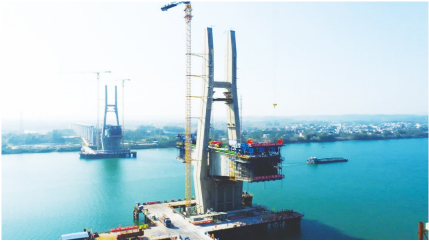
南玉铁路六景郁江特大桥第六节段完成浇筑。