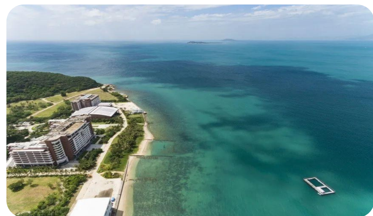
中科院深海所办公楼前的珊瑚礁海域

你可能会纳闷,珊瑚变白究竟意味着什么?对我们会产生什么影响呢?我们平时在媒体上看到的珊瑚五彩缤纷,在工艺品店看到的珊瑚大都是白色,这是不是所谓的“白化”?是谁为珊瑚染上颜色?又是谁夺走了珊瑚的颜色呢?