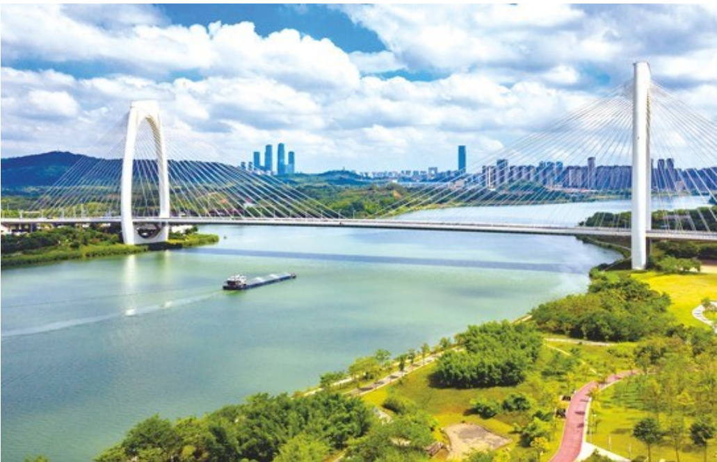
船舶在百里秀美邕江上航行

西津水利枢纽二线船闸通航离不开南宁港航发展中心的大力支持。今年以来,南宁港航发展中心通过大力优化营商环境等举措,实现了水路运输经济指标持续向好、水运基础设施建设项目稳步推进等目标任务,南宁市水路运输事业发展平稳有序。