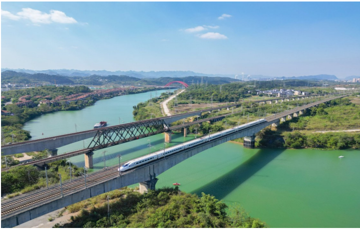
动车高速驶过南昆铁路平果右江双线大桥

2022年12月26日零时起,全国铁路实施2023年一季度列车运行图,国铁南宁局图定累计开行旅客列车332对,其中动车组290对,南凭高铁南崇段安排动车15对,