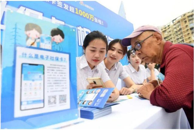
社保卡线上服务，即以电子社保卡作为线上服务统一载体，向群众提供“一卡通”服务，向政务服务平台和相关社会渠道输出“一站式”服务等。

根据通知，更多民生服务领域的“一卡通”应用将进一步丰富，并结合智慧城市和数字社会发展，创新电子证照、线上服务、数字空间等数字应用。 针对重点人群，各地人社部门将扩大社保卡在校园、企业、园区、社区等的应用，推进儿童学生、老年人、残疾人、农民工、灵活就业人员、新就业形态劳动者等重点人群“一卡通”服务；坚持传统服务和智能化服务“两条腿”走路，为老年人、残疾人提供多元化、人性化服务。 通知提出，依托全国一体化政务服务平台支撑能力，加快推动“多卡集成”“多码融合”，支持以实体社保卡为载体加载各类民生服务卡功能，以电子社保卡为载体提供省、市“一码通”服务，与政务服务码、其他行业码互通互认。探索推进社保卡加载数字人民币。 在“一卡通”应用模式方面，人社部门将推进电子