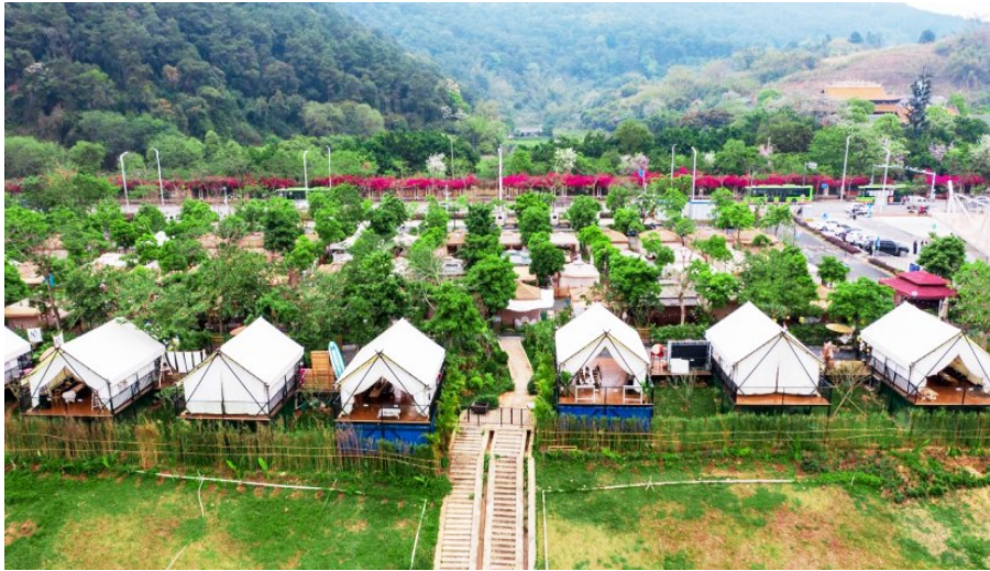
孔庙码头户外露营基地

水清、岸绿、景美,百里秀美邕江成为热门打卡地,游人如织,这幅和谐美丽的生态画卷,映照出南宁人的幸福生活。