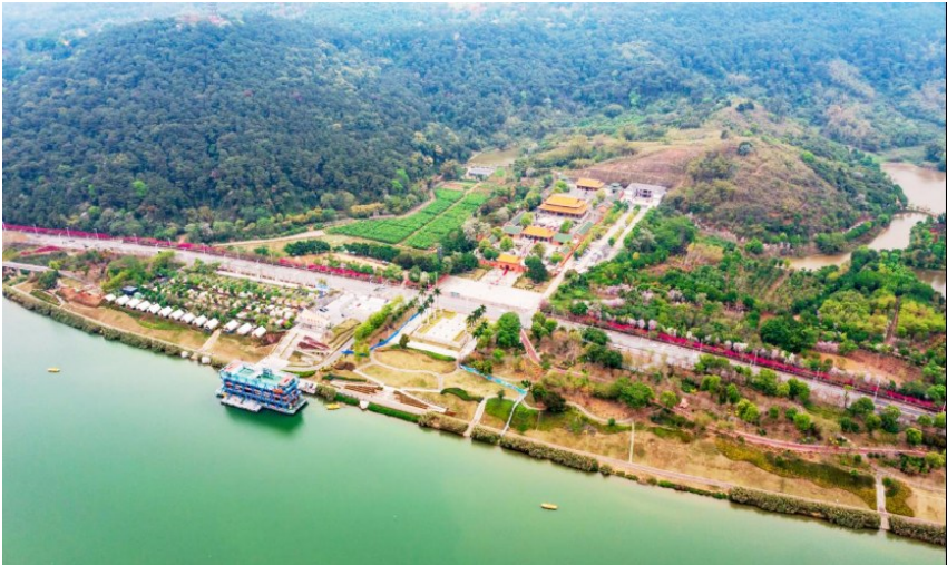
百里秀美邕江孔庙休闲旅游区段

邕江自西向东穿过绿城南宁,孕育了一代又一代人的南宁人。近年来,南宁市持续开展邕江两岸综合整治和开发利用。当你从空中俯瞰,一条交通轴、经济轴、生态轴、文化轴、景观轴的百里秀美邕江画面清晰可见。这样的美景,为即将在南宁召开的“2023年广西文化旅游发展大会”增光添彩。