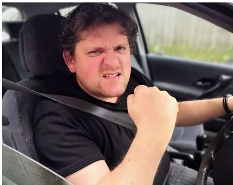
挥拳头和皱眉头的司机

光看照片,你觉得他是有路怒症?还是在为心爱的球队得分而挥拳庆祝?如果将来我们的自动驾驶车辆中配备了情绪识别AI,能够在感知到司机路怒时强行停车,那么问题就来了:为了庆祝而高举的拳头可能会把我们困在路边。