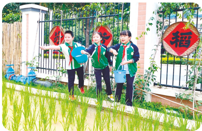
南宁市兴桂教育集团开辟“芬芳稻作园”等校内劳动基地

将耕读教育和教育教学相融合,让师生一边“耕”,一边“读”,既增长知识,增强本领,又从流汗实践体验中锻造优良品格。学生们在班主任和各学科教师的讲解下,学习了耕种工具的使用方法和农作物的种植方法,纷纷挽起裤腿,撸起衣袖,拿起农具、种苗和化肥,翻土、测距、播种、培土、洒水,栽种了向日葵、玉米、紫苏、茄子、辣椒、西红柿、沃柑、石榴等农作物。“学校坚持以耕读劳动教育为载体,把学科教育、思想品德教育、生活技能教育有机融合,积极引导重视生活体验与书本知识的内在融通。”那洪中学校长谷宜阳说,例如在劳动课上,学生们可以用生动的文字来描绘植物的生长过程,感受到语文的魅力;生物老师可以现场教学植物品种和生长习性;学生们可以将基地的土壤带到化学课堂,自己动手测验酸碱性和了解碱的腐蚀性;艺术老