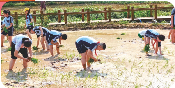
南宁市五象新区第三实验小学学生在乡村水田中插秧

南宁市五象新区第三实验小学1806班的同学们来到青秀区南阳县镇古岳坡文化艺术村,脱下鞋,挽起裤脚,下田插秧。经过一个多小时的插秧实践,明晃晃的水田变绿了,一棵棵秧苗排成行,虽有几棵歪着,但间距合理,苗势挺拔。另一边,南宁市良庆区琼林学校的学生也在校内劳动基地开展了种植蔬菜活动。