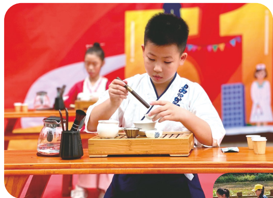
南宁市大学东路小学茶艺比赛展示茶文化

版)》,明确从2022年秋季学期开学开始,“中小学生学习做饭、修理家电、种菜养殖……”。一年时间过去了,各学校的劳动教育情况如何?探索出哪些有效的劳动教育模式?怎样才能让孩子们真正在劳动中学习本领,让“劳动最光荣”植根心中?