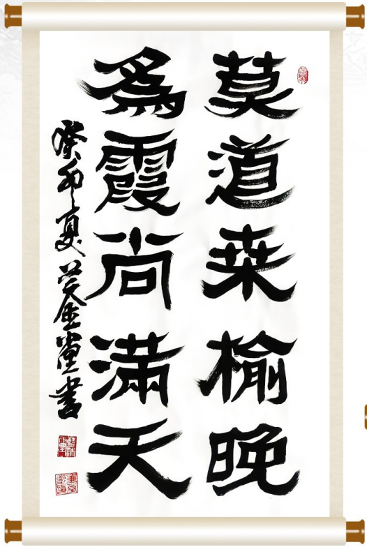
莫道桑榆晚 为霞尚满天

自从《南宁广播电视报》开展向社会征集展现老年人精神风貌的作品以来,得到了不少老年朋友的热情回应,纷纷给我们发来自己的书画、诗歌等作品,今天编辑整理了部分优秀作品进行展示。