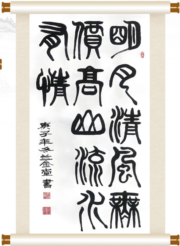
明月清风无价 高山流水有情