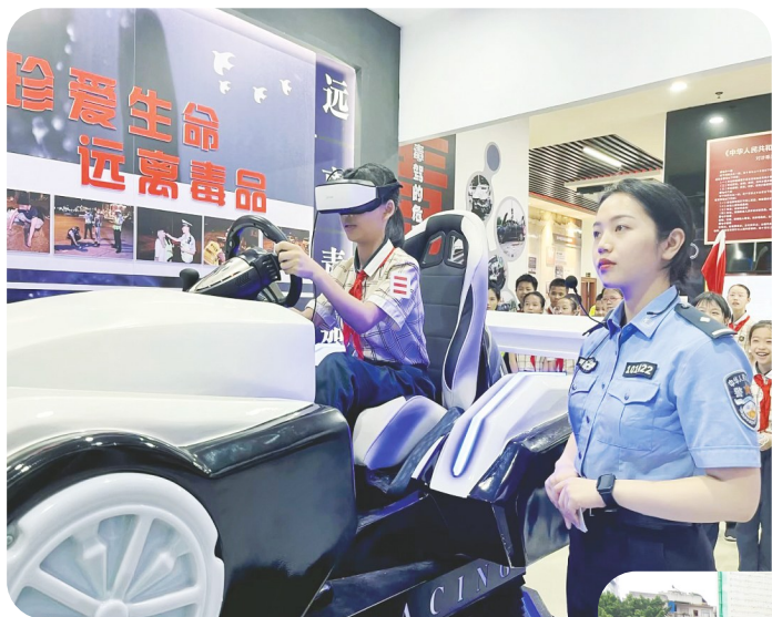
南宁市林里桥中段小学学生模拟吸毒后驾驶操作