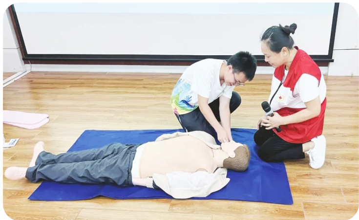
南宁市兴宁区第一初级中学开展急救救护暨防溺水知识技能培训

时下天气回暖,气温逐渐升高,溺水事故进入易发高发期。南宁市各学校开展了防溺水主题教育,以有效防止溺水事件的发生,全面提高学生的安全防范意识及自护自救能力。