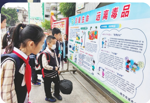
南宁市逸夫小学在校内开展常态化禁毒宣传教育

南宁市五一东路小学联合江南区禁毒办、南建社区开展“禁毒校园行,健康人生路”禁毒宣传教育活动。活动现场,江南区禁毒办警官结合学生生理和心理特点,通过知识讲授、参观毒品模型、观看禁毒教育视频、交流互动问答、游戏竞答等方式,向学生宣传新型毒品的种类及特征、毒品对社会和个人的危害等,号召学生在日常生活中增强防范意识,自觉抵制诱惑,远离毒品危害。