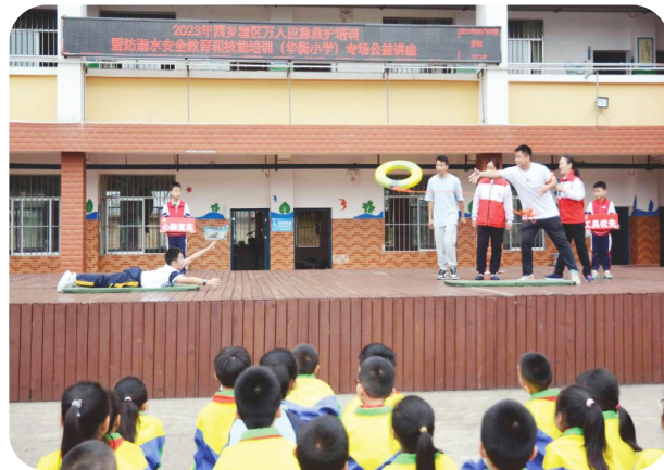
南宁市华衡小学师生在红十字会工作人员的指导下开展急救救护技能培训

南宁市智兴路初级中学联合南宁市江南区红十字会开展了万人应急救护暨中小学生防溺水知识技能培训,共同学习应急救护知识。红十字会队员向同学们讲解了防溺水、现场急救、心肺复苏和海姆立克急救法等救护知识,并邀请部分同学上台模拟对落水者进行施救、心肺复苏,同时进行海姆立克急救法演示。