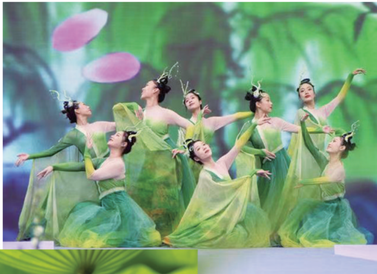
载歌载舞蹈春来