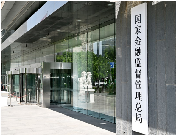
国家金融监督管理总局。

三、不贪图“一时便宜”因小失大。消费者要树立科学理性的投资理财观念,切忌侥幸心理、赌博心态。对陌生来电、邮件推销等非正规网络途径诱导投资行为保持警惕,不随意点击不明链接或扫描二维码,不轻易授权非官方App使用协议;拒绝与陌生人共享实时位置、分享含