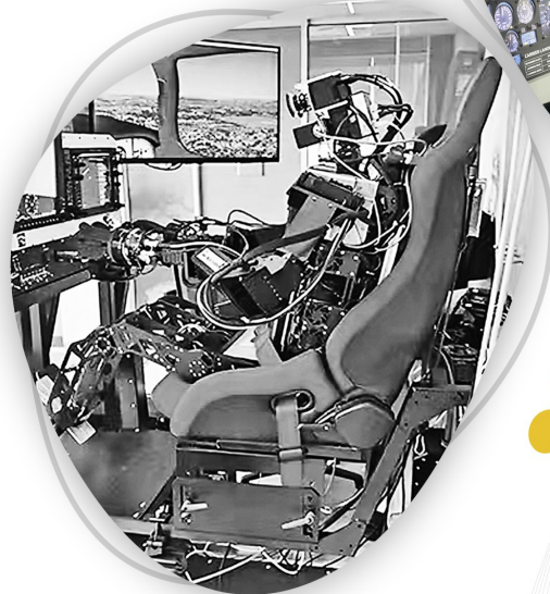
人形机器人正在操作飞行模拟器