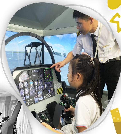
苏35战斗机飞行模拟器

的灵魂。而要搭建数学模型,则离不开包括网络技术、图形图像处理技术、软件工程、信号处理技术、自动控制技术、分布式交互仿真技术等在内的诸多技术的支撑。