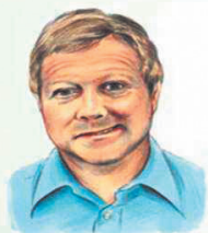
面瘫 不能微笑，口角歪斜

脑卒中是突发疾病，症状通常无痛、短暂、突如其来，常表现为面瘫、肢体无力、言语困难，部分患者会突然昏迷或看不清东西