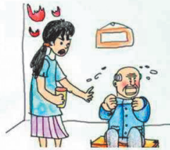
言语困难 吐字不清，沟通困难

脑卒中，又称中风，是一种急性脑血管疾病，以其高发病率、高复发率、高致残率、高死亡率的“四高”特点，成为我国成人致死、致残的首位病因。