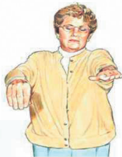
肌体无力 不能伸举上肢、下肢