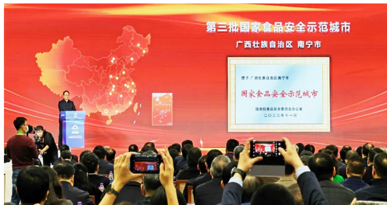
南宁市获“国家食品安全示范城市”荣誉称号