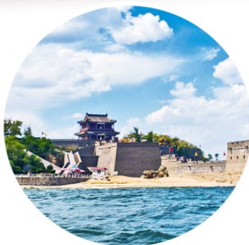
山海关老龙头景区

“接天莲叶无穷碧，映日荷花别样红”“两岸猿声啼不住，轻舟已过万重山”“飞流直下三千尺，疑是银河落九天”……山河锦绣，壮美如画，自古以来，许多文人墨客用笔下的诗词记录了所见美景，抒发着对广袤山河的赞美与热爱。让我们跟着古诗词一起，游览祖国的大好河山，领略各地的秀美风光。