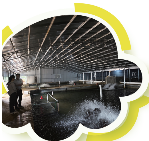
上林县白圩镇大浪村 鳗鱼养殖基地内景

大浪村秉持“绿水青山就是金山银山”的生态发展理念,通过树立村规民约来引导村民,改变思想,让优美的生态环境转化为绿色资源的有效利用,发展各种特色产业,联农带农提高农民增收致富能力,希望大浪村村民未来的日子在绿水青山间越过越有奔头。