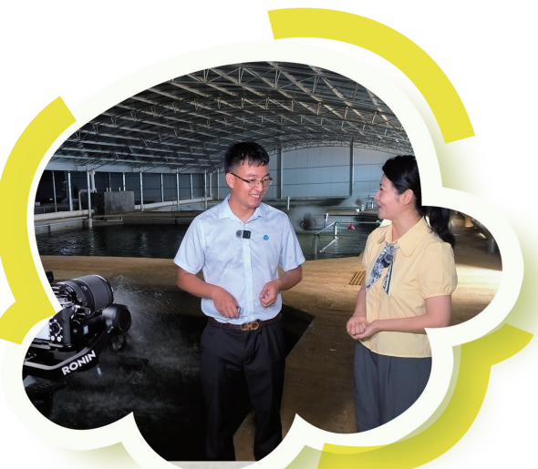
上林县白圩镇大浪村 鳗鱼养殖基地负责人介绍情况

近年来,大浪村通过发展养殖业、光伏发电项目以及沃柑产业等村集体经济,截至2023年12月,全村集体经济收入达到16.4万元,较上一年增长23%。目前村集体经济收入分配使用主要用于建设大浪村公益事业和帮助困难群众、因突发事件导致家庭困难等临时救助,有效地巩固了脱贫攻坚成果,同乡村振兴有效衔接。