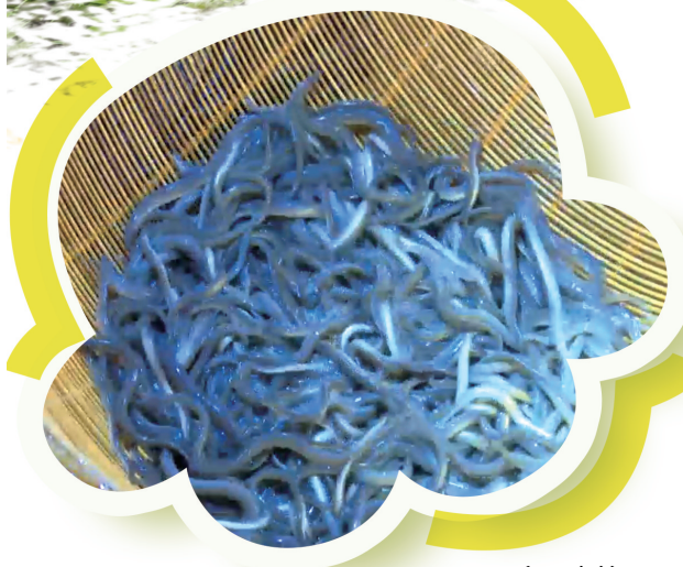
上林县白圩镇大浪村 鳗鱼养殖基地养殖的鳗鱼

据了解,接下来上林县将联合企业,准备将大浪村打造成集鳗鱼养殖、特种水产饲料加工、观光式水产食品加工、鳗鱼文化馆、特种水产研究、休闲文旅和商业贸易等为一体的“鳗鱼小镇”,为助力上林县乡村振兴作出贡献。